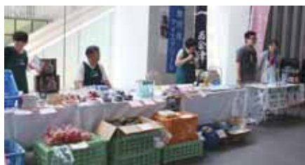
富士ソフト秋葉原ビル1Fでの「企業マルシェ」の様子

被災地支援として、秋葉原ビルの1階に企業マルシェを開いて、岩手県田舎野畑村及び福島県西会津町の新鮮野菜や特産品の展示販売を実施し、地域の皆様にもご購入いただいている。