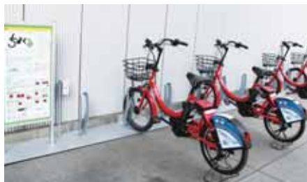
富士ソフト秋葉原ビルの「ちよくる」駐輪場

区のコミュニティサイクル事業実証実験実施に伴うサイクルポートをビル敷地内に設置している。