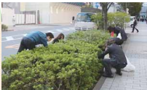
千代田区の一斉清掃に社員が参加

ゴミの分別はオフィスと地下ゴミ集積場の2段階で確認作業を実施することで、100%ゴミの分別を達成している。