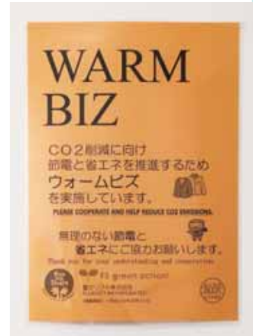
会議室のWARM BIZポスターはカラー紙に白黒印刷

空調に頼らない服装の推進 通年で全オフィスへ、独自のecoBIZ、夏期及び冬期はCOOLBIZ・WARMBIZのポスターの掲示もしくは活動の推進を実施している。