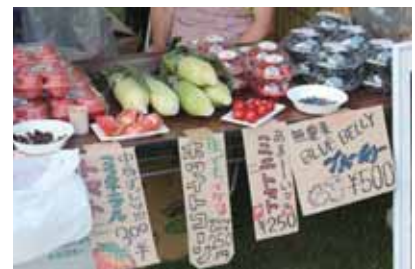
「企業マルシェ」では新鮮でおいしい野菜が並び