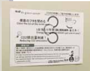
トイレ内に貼られた省エネポスターも英語併記で

環境啓発ポスターによる社内教育では、外国籍社員向けに英語版ポスターや社員の目線に合わせた位置に掲載するなど、全社員が取り組む工夫を推進している。