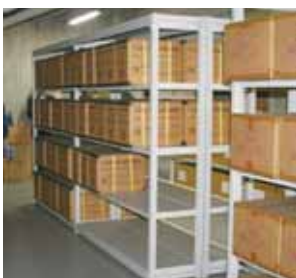
富士ソフト秋葉原ビルの地下にある千代田区の備蓄品