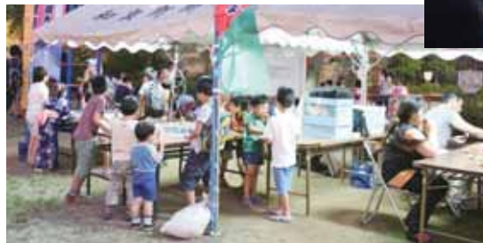
和泉公園での秋葉原東部納涼大会の様子

和泉公園で開催される秋葉原東部納涼大会に参加し、紙ヒコーキ制作教室とロボット相撲体験を実施している。