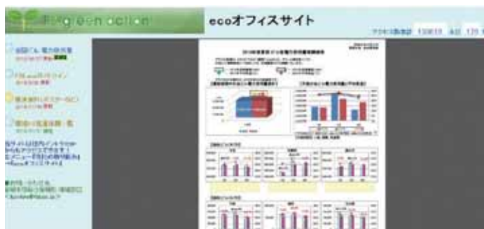
全国オフィスの電力使用量実績を社内イントラで見せる化

社内イントラネットサイトにecoオフィスサイトを開設し、国内全拠点の電力使用量を見せる化している。