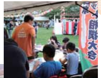
秋葉原東部納涼大会での富士ソフトのブース