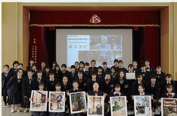
1年生との合同プロジェクトも実施。地域で働く人への取材を通して動きがいや地域への想いをSDGs視点でポスターにまとめました。

これからも生徒たちが地域と密接に連携し、そこで生まれた新たな出会いをもとによりよい社会を作り上げていけるよう多様な取り組みを実施していきたいと思えます。