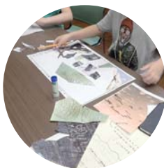
「夏の巻」の実施風景 撮った写真などを使って工作中

スマートフォンやタブレットのカメラに取り付けるとそれが顕微鏡に早変わりするキットです。ものすごくかんたんにスマホが顕微鏡になります。今回の参加者にはタブレットとセットで無料で貸し出します。(お子さまのみとなります)