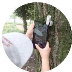
「夏の巻」の実施風景 スマホ顕微鏡で撮影中