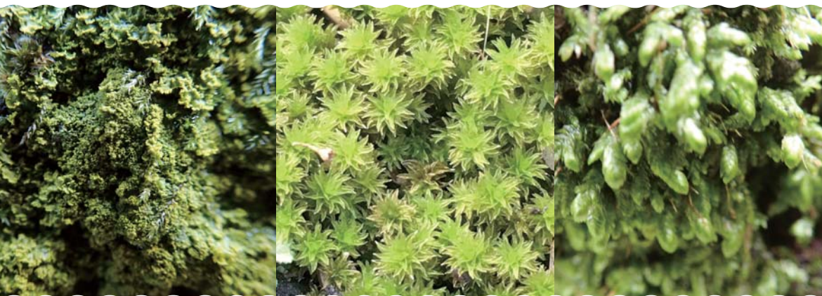
日比谷公園に生えているコケの例

主催：一般社団法人 千代田エコシステム推進協議会 千代田区九段南1-2-1千代田区役所5階 / Tel: 03-5211-5085