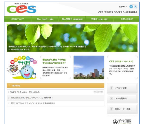
第一弾リニューアル後のデザイン