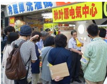
今年度もどうぞ期待 (写真は昨年度エコツアーの様子)

新年度に入り、去る 4 月 15 日（月）に、第 1 回環境リーダー会議を開催しました。